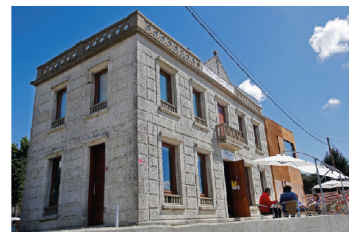
Unión do Porvenir

O Espazo Fortaleza é un área recuperada para o uso público por parte do Concello de Tomiño. Trátase do contorno da Fortaleza de San Lourenzo en Goián. Foi construído por enriba do forte primitivo, chamado "Forte da Barca" en torno á sinatura do Tratado de Paz con Portugal, en 1668, co obxectivo de reforzar a defensa da zona de cara a un posible novo conflito con Portugal. A edificación destaca por ter unha das plantas máis interesantes do conxunto galego, pola súa perfección e simetría. Na actualidade o Espazo Fortaleza ofrece ao visitante un área de esparcemento á beira do Río Miño onde poder disfrutar da natureza e de pasear ou andar en bicicleta. En 2014 resultou finalista do VI Premio de Arquitectura Enor.