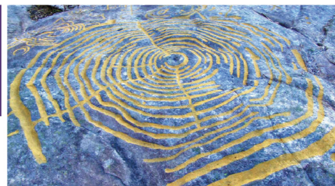
Petroglifos Monte Tetón

O Monte Tetón, situado na parroquia tomiñesa de Tebra, no límite co municipio de Gondomar, ten un dos conxuntos de arte rupestre máis importantes de Europa, con grabados que datan de fai uns 4000 anos. As representacións circulares do repertorio iconográfico desta estación rupestre son as máis grandes de Europa atopadas até o momento. O denominado Petroglifo de Real Seco presenta unha impresionante formación de 17 aneis concéntricos de 3,5 m de diámetro máximo. Pola súa banda o Petroglifo de Portaxes presenta unha combinación de 18 aneis concéntricos que acadan os 2,5 m de diámetro máximo.