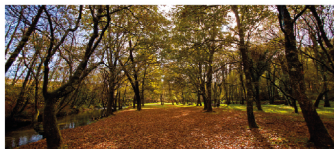
Área recreativa fluvial da Pedra

O Miño é protagonista no municipio de Tomiño, e ofrece un contorno natural privilexiado para aqueles que buscan espazos de natureza e actividade ao aire libre. De recente creación, Tomiño conta cunha senda fluvial que discorre paralela ao río Miño, e que ofrece un percorrido idóneo para pasear, andar en bicicleta ou gozar das panorámicas do río e da beira de Portugal.