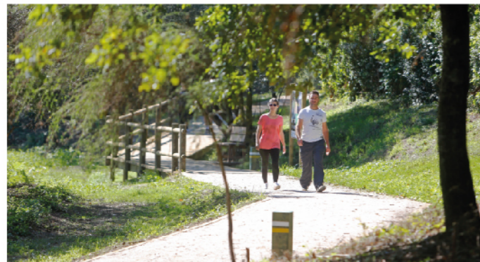
Senda do río Miño

O Miño é protagonista no municipio de Tomiño, e ofrece un contorno natural privilexiado para aqueles que buscan espazos de natureza e actividade ao aire libre. De recente creación, Tomiño conta cunha senda fluvial que discorre paralela ao río Miño, e que ofrece un percorrido idóneo para pasear, andar en bicicleta ou gozar das panorámicas do río e da beira de Portugal.