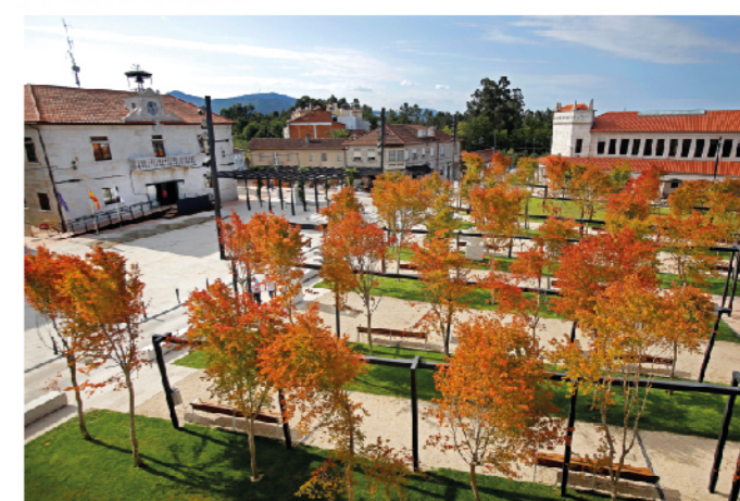
Praza do Seixo e Mercado

A Unión do Porvenir forma parte do conxunto de Escolas Indianas de Tomiño. Foi promovida por unha sociedade de emigrantes tomiñeses establecidos en Nova York no ano 1918, co obxectivo de apoiar a formación dos escolares mediante unha escola de ensinanza primaria. Foi inaugurada no ano 1933. Atópase ao carón da estrada PO-350 que une Hospital con Areas (Tui), no límite entre as parroquias de Tabora e Piñeiro.