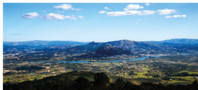
Mirador da Pedrada

A Serra do Argallo é a formación montañosa que domina todo o val de Tomiño, xunto co final da Serra da Groba e do Galiñeiro, e constitúen interesantes enclaves naturais que albergan numerosos miradores panorámicos e paisaxísticos. O Mirador do Niño do Corvo atópase no límite co municipio do Rosal, a 313 m de altitude. Proporciona ao visitante unha das máis fermosas vistas da comarca, dende o estuario do Miño até numerosas terrazas fluviais tomiñesas e do val do Rosal. O Mirador da Pedra Furada , en Figueiró, constitúe un fermoso enclave natural de gran singularidade xeolóxica pola presenza dunhas formacións rochosas furadas pola acción do vento e a choiva. Conta cun mirador panorámico a 204 m de altitude. O Mirador dos Viñedos de Vilachán ten a peculiaridade de ofrecer unha ampla panorámica da plantación dos viñedos e dos núcleos de Vilachán e Tomiño. O Mirador da Pedrada atópase no límite co municipio de Oia. A 517m de altitude, ofrece ao visitante unhas vistas inigualables do val de Tomiño e do val do Rosal. Nos días claros pode verse A Guarda e a marxe portuguesa do Miño.