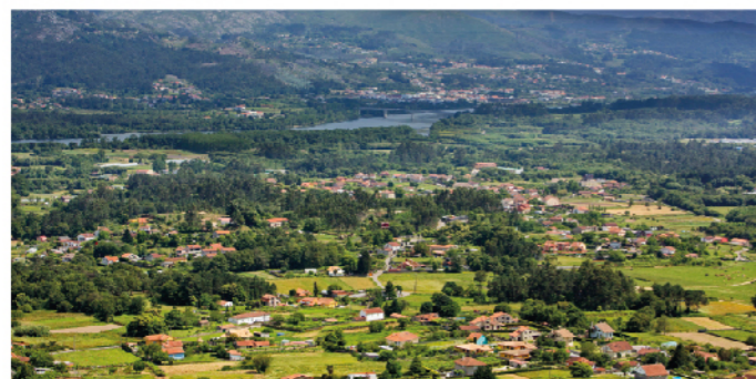
Mirador de Vilachán

A Serra do Argallo é a formación montañosa que domina todo o val de Tomiño, xunto co final da Serra da Groba e do Galiñeiro, e constitúen interesantes enclaves naturais que albergan numerosos miradores panorámicos e paisaxísticos. O Mirador do Niño do Corvo atópase no límite co municipio do Rosal, a 313 m de altitude. Proporciona ao visitante unha das máis fermosas vistas da comarca, dende o estuario do Miño até numerosas terrazas fluviais tomiñesas e do val do Rosal. O Mirador da Pedra Furada , en Figueiró, constitúe un fermoso enclave natural de gran singularidade xeolóxica pola presenza dunhas formacións rochosas furadas pola acción do vento e a choiva. Conta cun mirador panorámico a 204 m de altitude. O Mirador dos Viñedos de Vilachán ten a peculiaridade de ofrecer unha ampla panorámica da plantación dos viñedos e dos núcleos de Vilachán e Tomiño. O Mirador da Pedrada atópase no límite co municipio de Oia. A 517m de altitude, ofrece ao visitante unhas vistas inigualables do val de Tomiño e do val do Rosal. Nos días claros pode verse A Guarda e a marxe portuguesa do Miño.