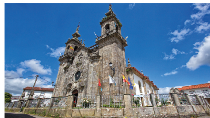
Igrexa de San Campio de Lonxe

A Igrexa Parroquial de Santa María de Tomiño atópase preto do centro da localidade. De estilo románico, foi igrexa dun antigo mosteiro feminino beneditino. É un referente moi importante do románico da zona, a pesar das reformas que sufriu en torno ao 1809. Conta cunha única nave e ábside rectangular, e a portada principal presenta catro arquivoltas sostidas por catro pares de columnas.