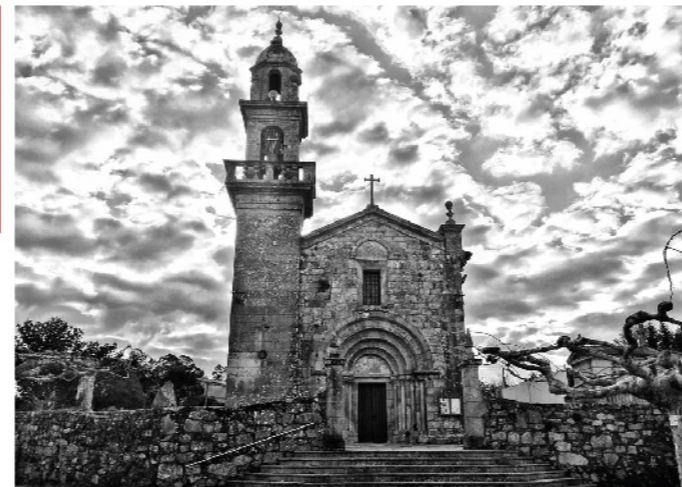
Igrexa de Santa María

A Igrexa Parroquial de Santa María de Tomiño atópase preto do centro da localidade. De estilo románico, foi igrexa dun antigo mosteiro feminino beneditino. É un referente moi importante do románico da zona, a pesar das reformas que sufriu en torno ao 1809. Conta cunha única nave e ábside rectangular, e a portada principal presenta catro arquivoltas sostidas por catro pares de columnas.