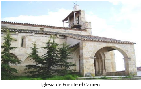
Iglesia de Fuente el Carnero

estanco, farmacia, y centro de salud. Si el viajero lo desea a la entrada de Corrales del Vino podrá desviarse, en la rotonda, a la derecha para ver Fuentelcarnero pueblo que junto a Peleas de Arriba pertenece al Municipio. Su Iglesia bajo la advocación de San Esteban, fue declarada en 2013, Bien de Interés Turístico y Cultural. Esta Iglesia se