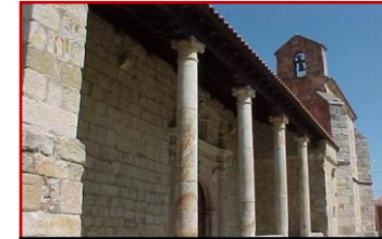
Iglesia San Félix

Para llegar a este pequeño pueblo, al que también pertenecen, las poblaciones colindantes de Tardobispo y San Marcial.