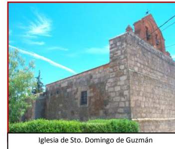
Iglesia de Sto. Domingo de Guzmán

El lugar de partida de esta marcha es la iglesia del Cubo dedicada a Santo Domingo de Guzmán. Es importante conocer que