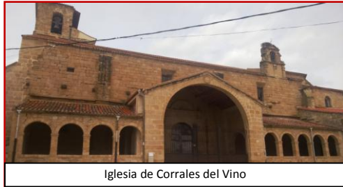
Iglesia de Corrales del Vino

En el término municipal de Corrales del Vino, el viajero, cuenta con todo tipo de servicios como dos supermercados, una panadería, dos carnicerías-salchicherías, bares-restaurantes, dos peluquerías,