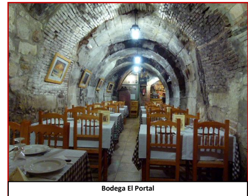
Bodega El Portal

Después de pasar por Corrales hay que continuar por la N-630 y en la tercera rotonda, que sale en la ruta, habrá que girar a la izquierda para tomar la carretera secundaria que lleva al viajero, directamente, a la meta de esta ruta. La Iglesia de San Félix es el monumento más característico (sin olvidar sus bodegas) en ella hay un sepulcro de gran valor y unas tablas de origen gótico.