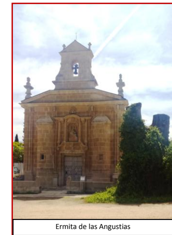
Ermita de las Angustias

El siguiente pueblo de referencia, en esta ruta, es Corrales del Vino donde se pueden encontrar diversos monumentos de relevancia cultural e histórica como por ejemplo la Ermita de Nuestra Señora de las Angustias (imagen de la izquierda centro) que se encuentra en la