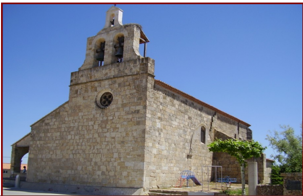
Plaza Montesinos, Fuente el Carnero

La Plaza Montesinos de Fuente el Carnero debe su nombre a Pablo Montesino Cáceres nacido en la localidad. Nacido en una familia acomodada estudió medicina. Años más tarde fue diputado de las Cortes de Extremadura y se opone abiertamente, a Fernando VII, lo que conduce a su exilio en Inglaterra. Creó la "Sociedad para mejorar la educación del pueblo", y a raíz de aquí fundó la Primera Escuela de Párvulos en 1838 en Madrid. En 1839, intervino en la reforma de la educación primaria, proponiendo que hubiese Jardines de Infancia y una mejora de la educación femenina. Una de sus obras más conocidas fue "Manual para maestros de la escuela de Párvulos". En este incluyó todas sus ideas pedagógicas, y fue el primer tratado teórico que hubo en España (1840).