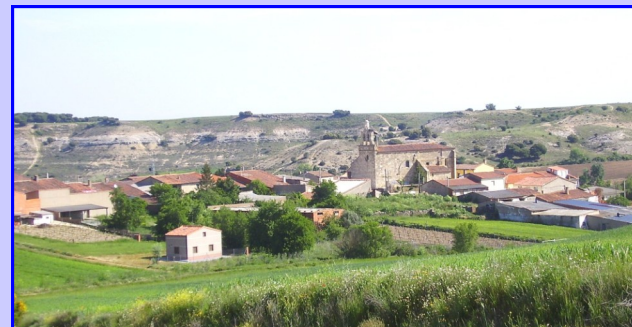
Vista de Fuente el Carnero desde Montegordo

Fuente el Carnero es una localidad situada a 20 km provincia de Zamora, enmarcada en la Tierra del Vino y pedanía perteneciente al Municipio de Corrales del Vino, cuenta con una población total de 53 habitantes, que junto a Bamba (Madridanos) son las localidades de menos población de la comarca. Anteriormente era la localidad principal, pero debido al trazado de las carreteras y una despoblación paulatina y deslocalización de sus habitantes a favor de Corrales del Vino, perdió la importancia que tenía anteriormente.