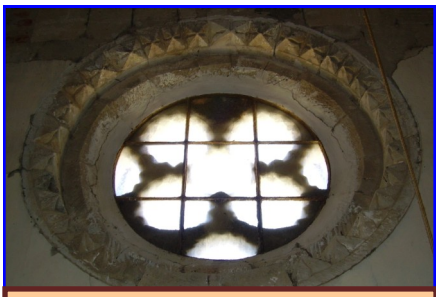
Rosetón tetralobulado vista interior

Y el rosetón tetralobulado con cenefa con chambrana de puntas de diamante colocado actualmente en el hastial occidental. En las fotografías de la derecha se presentan dos imágenes: Vista exterior del rosetón situado debajo de la espadaña y vista desde el interior donde se aprecia como incide la luz