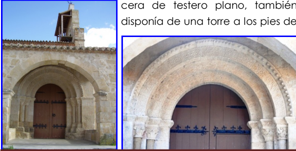
Portada de tres arquivoltas

Obra Exterior: En principio se trataba de una edificación de tres plantas separadas por seis arcos formeros y cabecera de testero plano, también disponía de una torre a los pies de