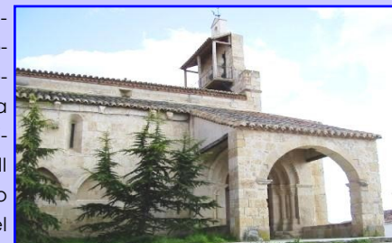
Exterior de la Iglesia de San Esteban

La Consejería de Cultura y Turismo, Dirección General de Patrimonio Cultural ACUERDA el 26 de septiembre del 2013, declarar la Iglesia de la Invencción de San Esteban de Fuente el Carnero, Bien de Interés Cultural (BIC). Se trata de un magnifico ejemplo de monumento del tardorrománico, Se comenzó a levantar en la segunda mitad del siglo XII y se finalizó terminado el siglo siguiente.